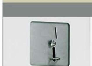
Controllo Self-service (AUT-ME) Microprocessore esclusivo per l'essiccatore STI-14 versione self-service.