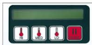
Control Vending (AUT-VE)