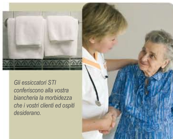
Gli essiccatori STI conferiscono alla vostra biancheria la morbidezza che i vostri clienti ed ospiti desiderano.