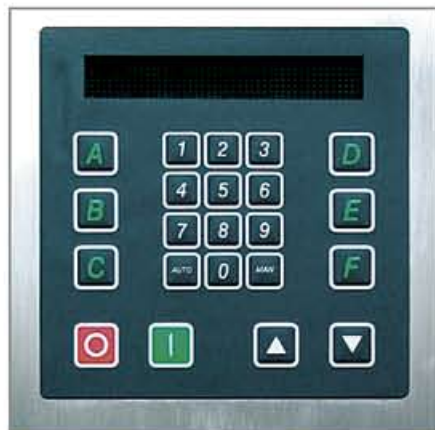
Controllo Standard (S): durante il ciclo, il display informa l'operatore sulla temperatura, sul tempo residuo e sul tempo del ciclo di raffreddamento.